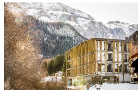
© Mountain Design Hotel Eden Selva

"Das Hotel wurde mit Blick auf die Zukunft entworfen: Es wurde mit zertifizierten und umweltfreundlichen Materialien gebaut. Wir haben neue Pläne, um die vorhandene Wasser- und Windkraft zu nutzen. Wir versuchen, in jeder Hinsicht und in jedem Detail konsequent nach unserer Philosophie leben: von der Mülltrennung über die Verwendung gesunder, biologischer und heimischer Zutaten in unserer Küche, die richtige Temperatur-/Wärmeregulierung in jedem Zimmer, die Schneeräumung im Winter von Hand bis hin zu unserem Personal, das in all diesen Aspekten geschult wird und versucht, unsere Kunden entsprechend zu sensibilisieren."